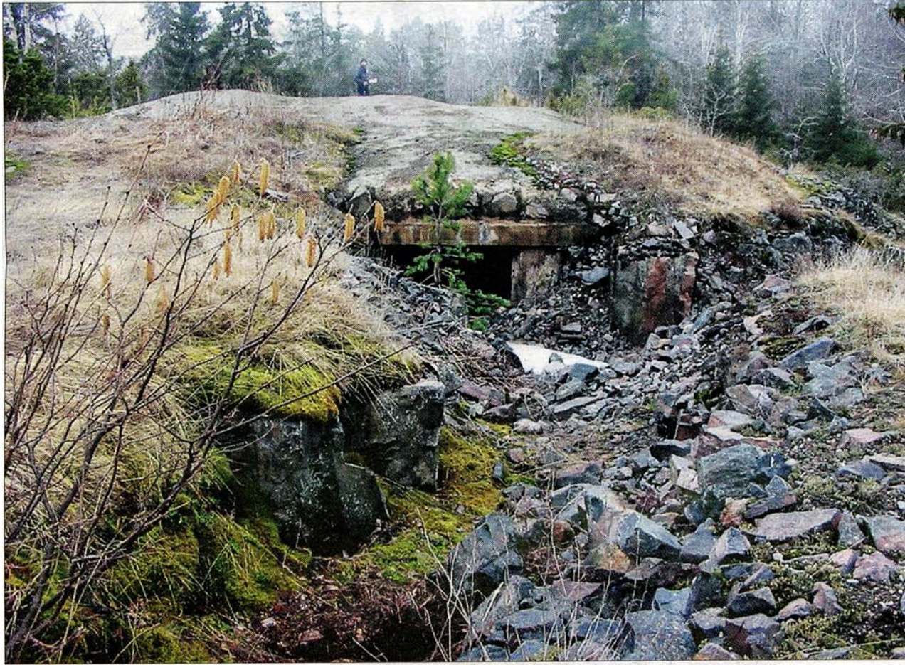
Militären har lämnat stora områden med sprängsten efter sig på fastigheterna.